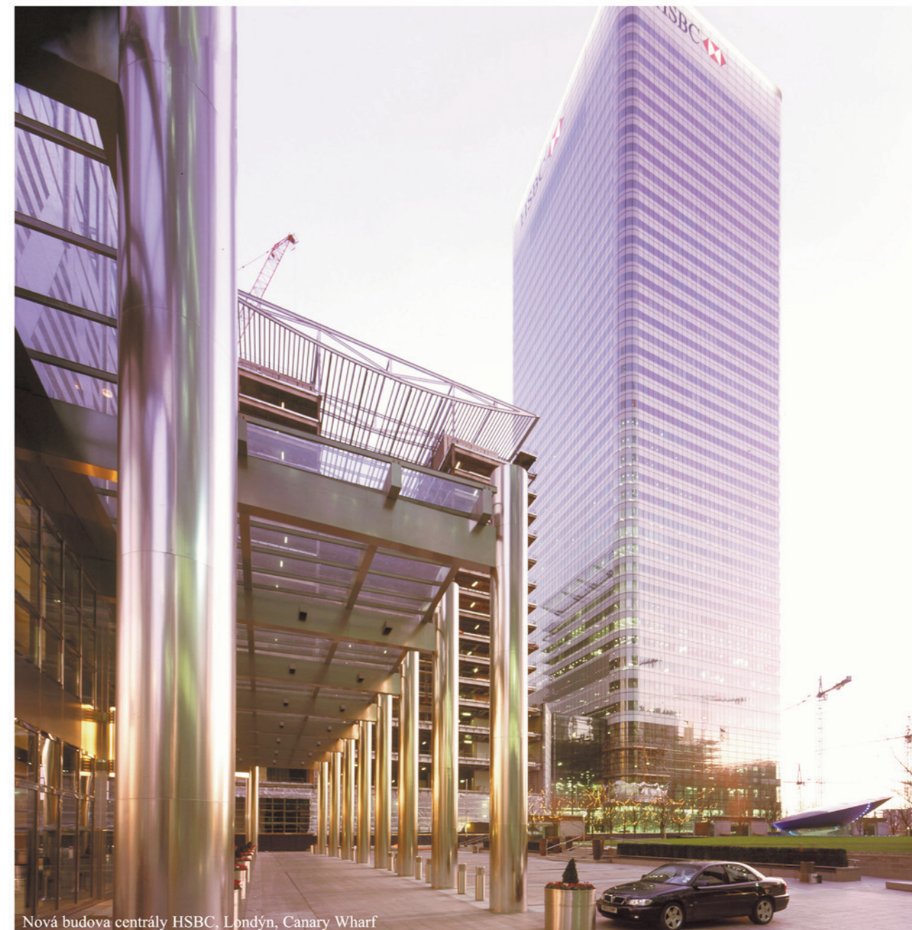
Nová budova centrály HSBC, Londýn, Canary Wharf