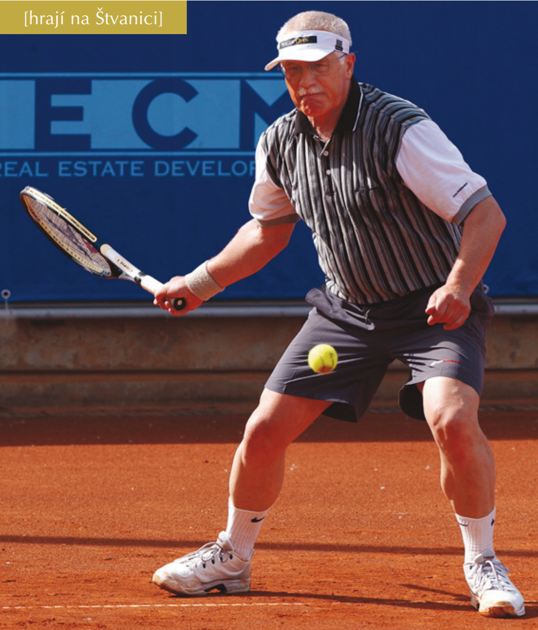
Prezident Václav Klaus a jeho stylový forhend