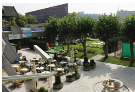
Terasa klubové restaurace a v pozadí bazén, v létě členy klubu hojně využívány

Pohled na štvanický areál v průběhu Prague Open 2005 - centrkurt patří podle smlouvy tenisovému svazu, zbývající kurty obhospodařuje I. ČLTK Praha