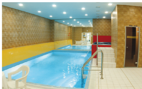
Luxurní regenerační linka s bazénem a vířivkou je majetkem svazu, členové I. ČLTK ji však mohou využívat