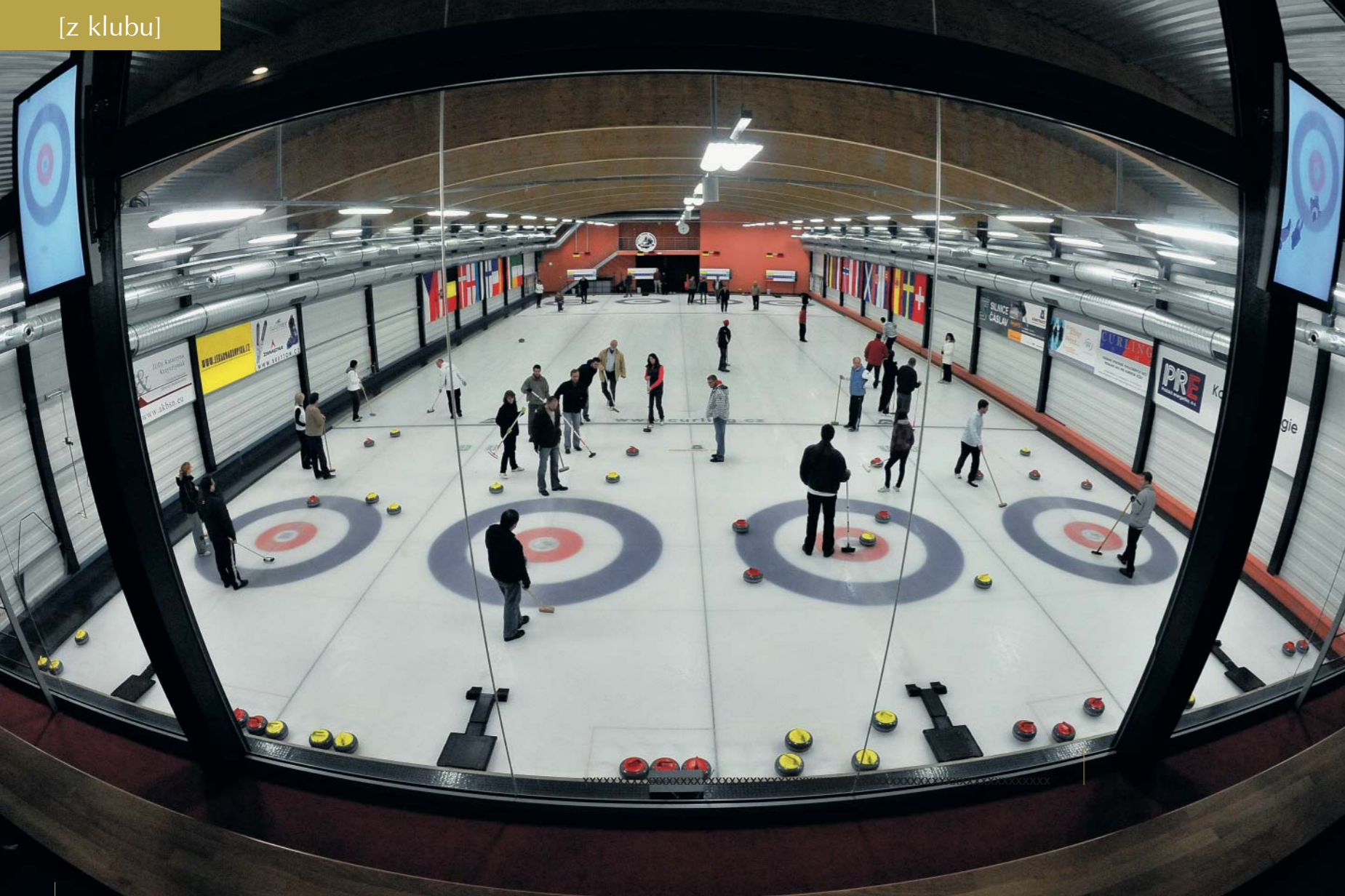
Curlingová hala v Roztylech patřila poslední nedělní večer v listopadu členům I. ČLTK Praha