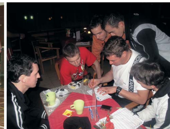
Příprava na orientační běh zpestřený vědomostními otázkami