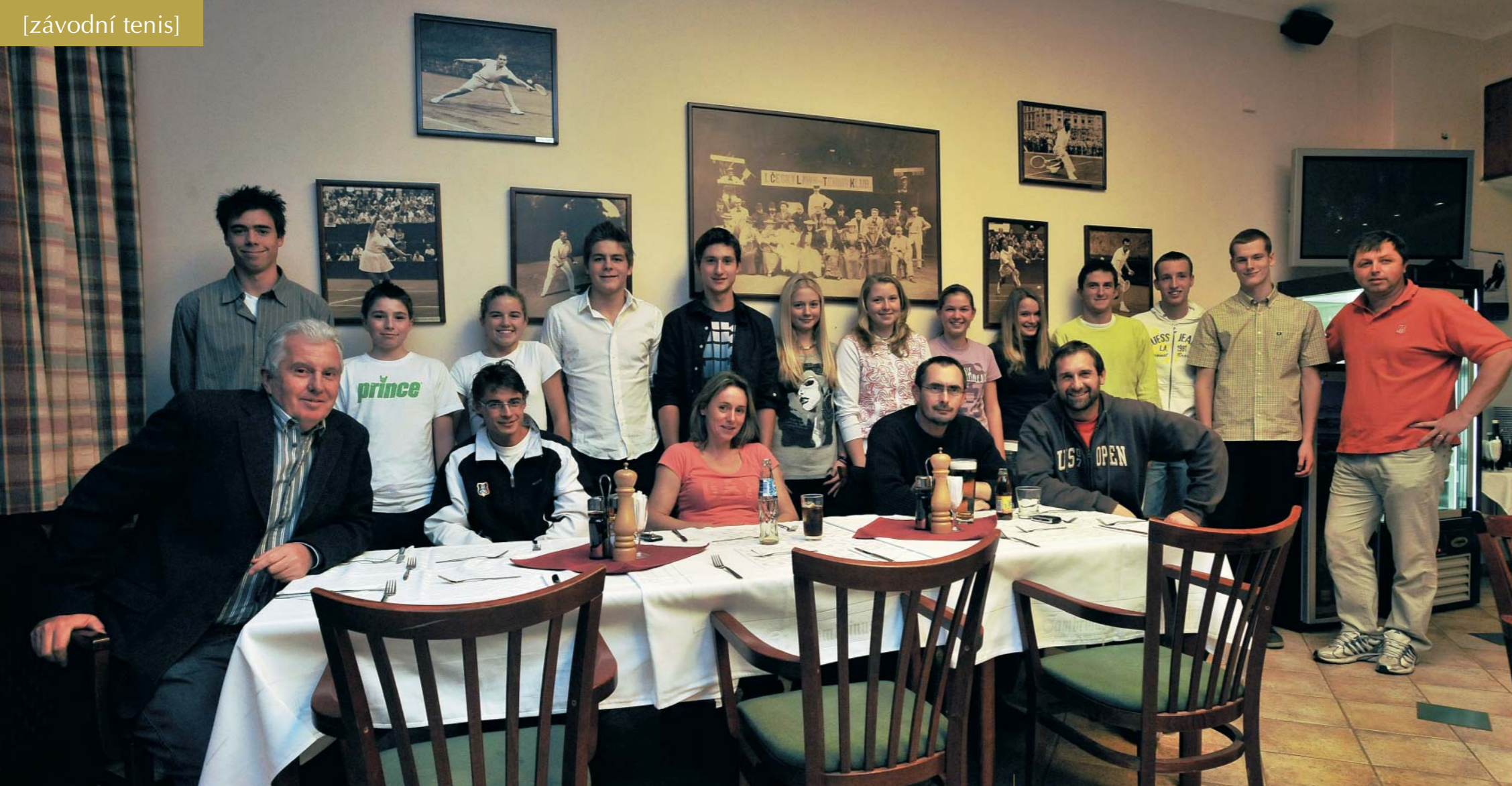
Na Večeři mistrů se sešli nejlepší hráči I. ČLTK ve všech mládežnických kategoriích se svými trenéry. A že bylo co slavit!