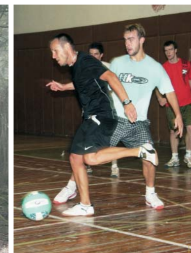
Fotbálek v tělocvičně byl na programu téměř každý den