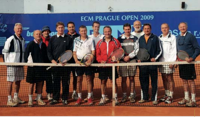
Aktéři přátelského utkání na Štvanici na společné fotce

Příjemnou novinkou pro všechny golfisty v I. ČLTK je nově navázaná spolupráce s Prague City Golf Club. V praxi to znamená, že členové klubu ze Štvanice mohou v pondělí a v úterý hrát na Zbraslavi za pouhých 500 korun, po zbylé dny v týdnu mohou využít desetiprocentní slevu na fee, které činí 1400 Kč, respektive 1800 Kč o víkendech a svátcích. Na hřišti Prague City Golf Clubu se v roce 2010 uskuteční i mistrovství I. ČLTK v golfu. Členové PCGC mohou na oplátku využívat slev při hraní na Štvanici. V jednání je i možnost společné roční členské karty.